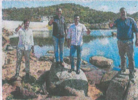
YURY do Paredão (PL), entre os ministros do governo Lula, faz o L

COMPARTILHADA POR APLICATIVO DE MENSAGEM