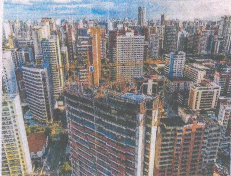
PLANO DIRETOR terá como um dos eixos desenvolvimento urbano

"É importante que entendam que é uma revisão, nós já temos um plano diretor vigente", frisu