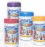
FIESTA WIPES LENÇOS UMEDECIDOS LINHA INFANTIL