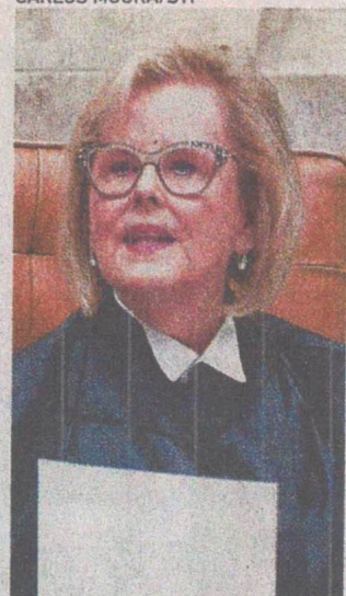
MINISTRA Rosa Weber, presidente do STF

A ministra Rosa Weber, presidente do Supremo Tribunal Federal (STF), afirmou nessa quarta-feira, 16, Dia Internacional da Tolerância, que liberdade de expressão não abriga agressões e manifestações que incitem ao ódio e à violência, inclusive moral.