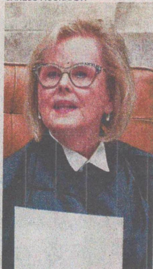
MINISTRA Rosa Weber, presidente do STF

A ministra Rosa Weber, presidente do Supremo Tribunal Federal (STF), afirmou nessa quarta-feira, 16, Dia Internacional da Tolerância, que liberdade de expressão não abriga agressões e manifestações que incitem ao ódio e à violência, inclusive moral.