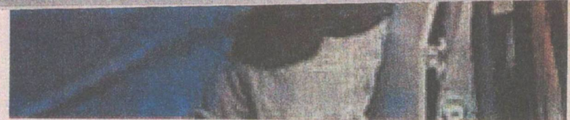
O SENADOR Cid Gomes foi alvo de disparos em Sobral durante manifestação de PMs em fevereiro de 2020

Também o senador Cid Gomes disse não poder reconhecer quem atirou contra ele. Conforme o depoimento dele, após tomar conhecimento do movimento paredista — que incluía, citou, comboios de militares fazendo sinais para comerciantes fecharem as portas — Cid, que estava em Fortaleza, se dirigiu a Sobral.