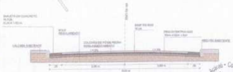
02 SEÇÃO TIPO ESCALA: 1:50