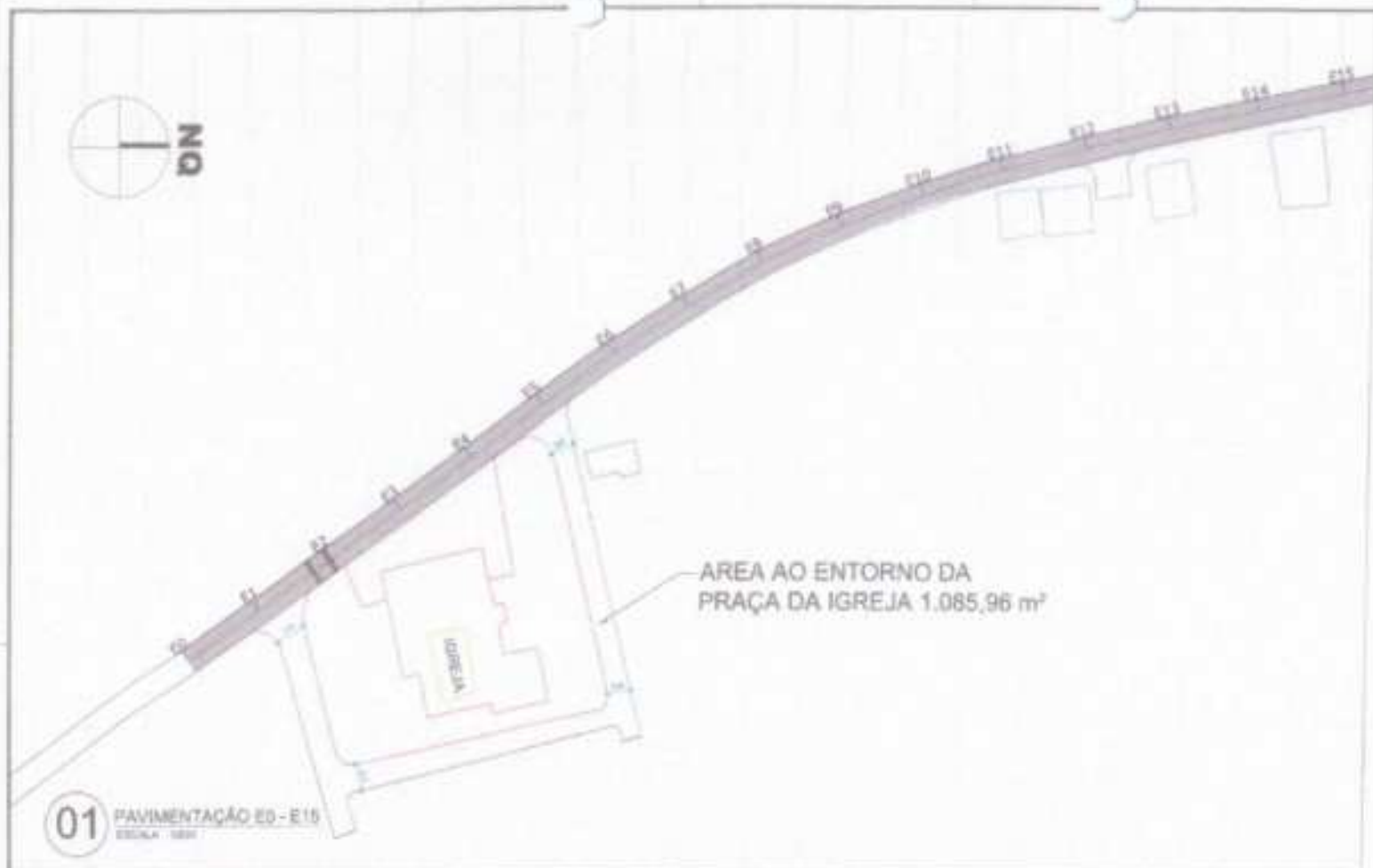
01 PAVIMENTAÇÃO ED - E 15 ESCALA: 1:500

AREA AO ENTORNO DA PRAÇA DA IGREJA 1.085,96 m 2