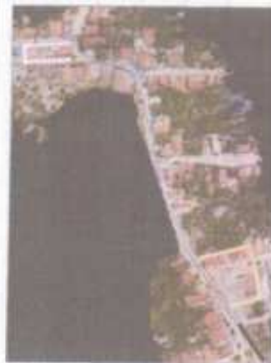
ÁREA AO ENTORNO DA PRAÇA

AREA AO ENTORNO DA PRAÇA DA IGREJA 1.085,96 m 2