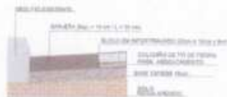
03 DETALHAMENTO DA SEÇÃO TIPO ESCALA: 1:50