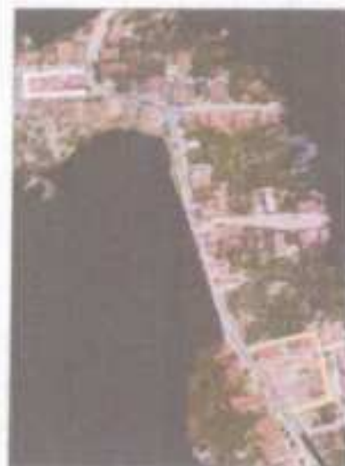
RETRILHAÇÃO DO TRECHO