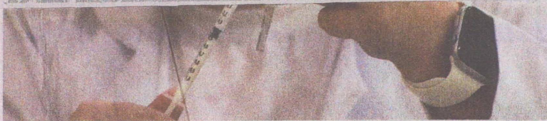
FORTALEZA aplicou quase 1,6 milhão de imunizantes contra a Covid-19 na população residente