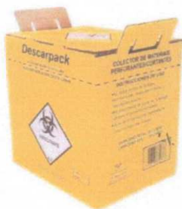
FIGURA 3 Caixa Descartex para descarte de Resíduo de Serviço de Saúde