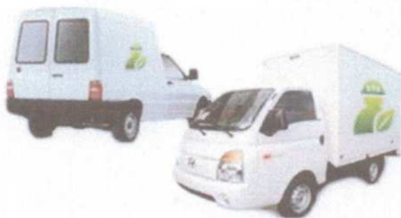
Ilustração do veículo para realização de coletas

No percurso de deslocamento para a descarga no destino final, todas as tampas de abertura do veículo coletor deverão estar completamente fechadas.