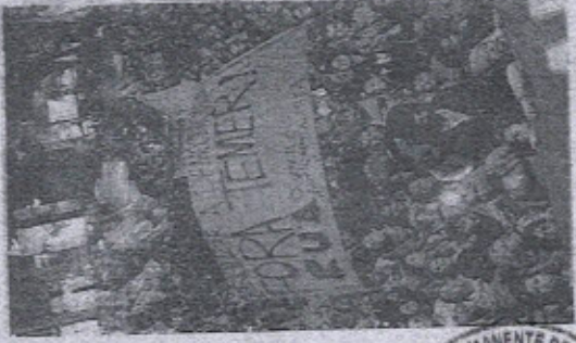
Ato contra o afastamento de Dilma Rousseff da Presidência

ESTADO DO CEARÁ - PREFEITURA MUNICIPAL DE ITAPIPOCA - AVISO DE LICITAÇÃO - PREGÃO PRESENCIAL Nº 16.11.001PP - O Município de Itapipoca-CE, por meio de seu Pregãoeiro Municipal, abre licitação para contratação de serviços de manutenção de veículos, para o ano de 2016, a ser realizada em 13 de maio de 2016, às 10h, no endereço: Rua Manoel Pires, nº 100, Centro, Itapipoca-CE. O Edital encontra-se no endereço: Rua Manoel Pires, nº 100, Centro, Itapipoca-CE. O interessado deve apresentar o formulário de inscrição em 12 de maio de 2016, às 10h, no endereço: Rua Manoel Pires, nº 100, Centro, Itapipoca-CE. O interessado deve apresentar o formulário de inscrição em 12 de maio de 2016, às 10h, no endereço: Rua Manoel Pires, nº 100, Centro, Itapipoca-CE. O interessado deve apresentar o formulário de inscrição em 12 de maio de 2016, às 10h, no endereço: Rua Manoel Pires, nº 100, Centro, Itapipoca-CE.