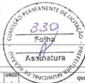
Tabela Fonte 25 --TABELA UNIFICADA SEINFRA (SEM DESONERAÇÃO) Endereço: AV. CAPITÃO DIDLO LOPES Nº, BAIRRO VER. ANTÔNIO LIVINO DA SILVEIRA, ACARAÚ/CE Cliente: PREFEITURA MUNICIPAL DE ACARAÚ Obra: META 07 - REFORMA DA PRAÇA DO IMBÉ NO MUNICÍPIO ACARAÚ/CE