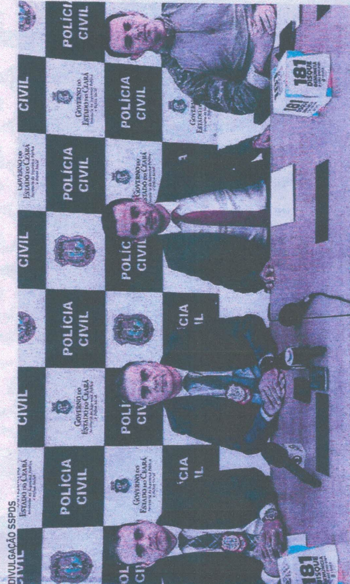
DELEGADOS durante coletiva para falar sobre a prisão do suspeito

seus familiares, e o agente de segurança, foi citado pelo mandante como parente de um morador da cidade. O inspetor, que era lotado no Departamento de Homicídios, estava de férias do trabalho e resolveu ver seus parentes em uma lanchonete na avenida