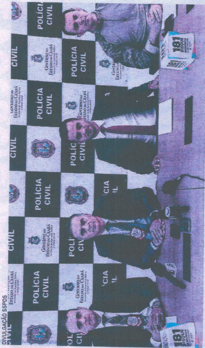
DELEGADOS durante coletiva para falar sobre a prisão do suspeito

seus familiares, e o agente de segurança, foi citado pelo mandante como parente de um morador da cidade. O inspetor, que era lotado no Departamento de Homicídios, estava de férias do trabalho e resolveu ver seus parentes em