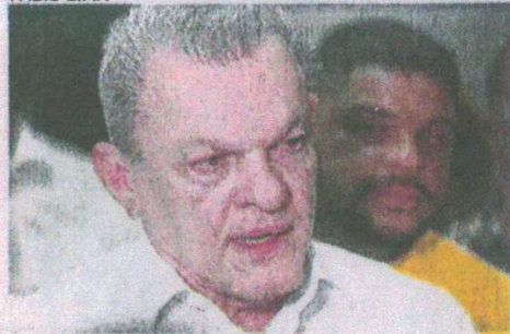
PREFEITO José Sarto nega repasso do Estado para tratamento de câncer