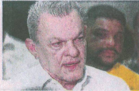
PREFEITO José Sarto nega repasso do Estado para tratamento de câncer